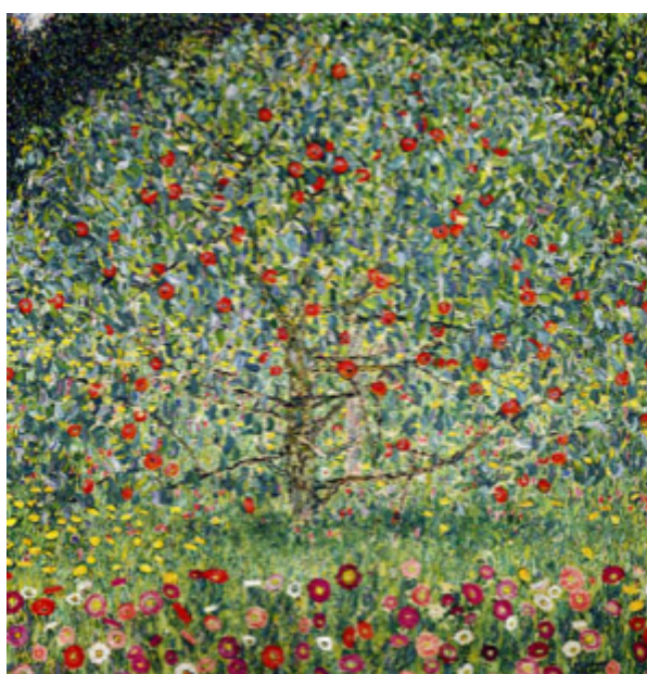
Le pommier - Gustav Klimt - 1912