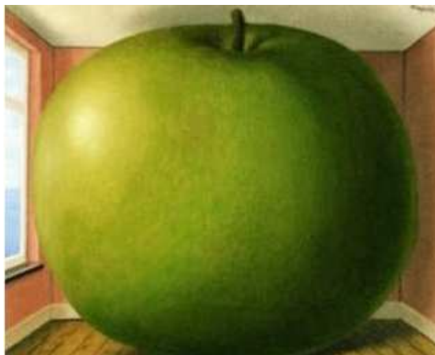
La chambre d'écoute