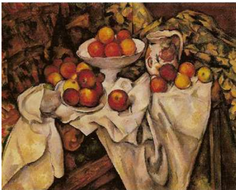
Paul Cézanne, Pommes et oranges , 74 x 91 cm, 1895-1900. Musée d'Orsay