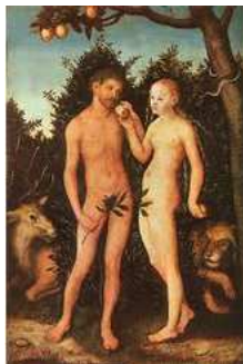
Adam & Ève - Lucas Cranach l'Ancien, 1531 - Staatliche Museen, Berlin

Croquer, cueillir la pomme. Se laisser séduire.