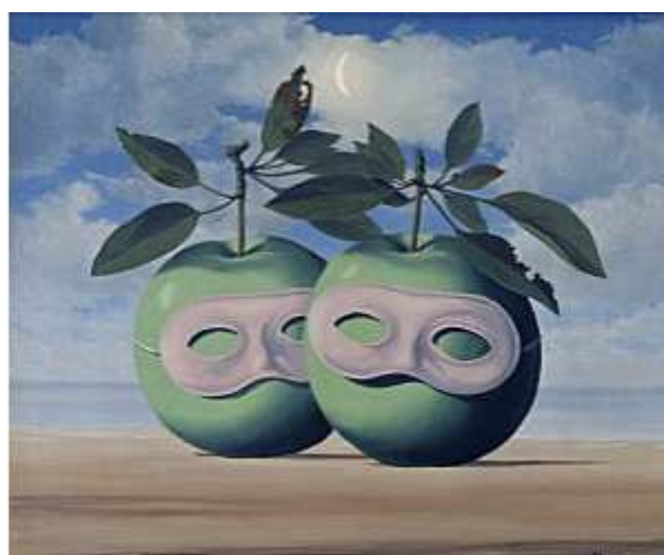
La valse hésitation