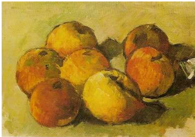
Paul Cézanne, Pommes(et tube de couleur), 16,5 x 23,5 cm, 1873-1877