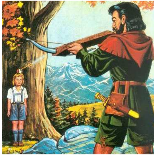
La légende de Guillaume Tell http://www.dinosoria.com/guillaume_tell.htm

La pomme qui étouffe Blanche Neige, conte des frères Grimm