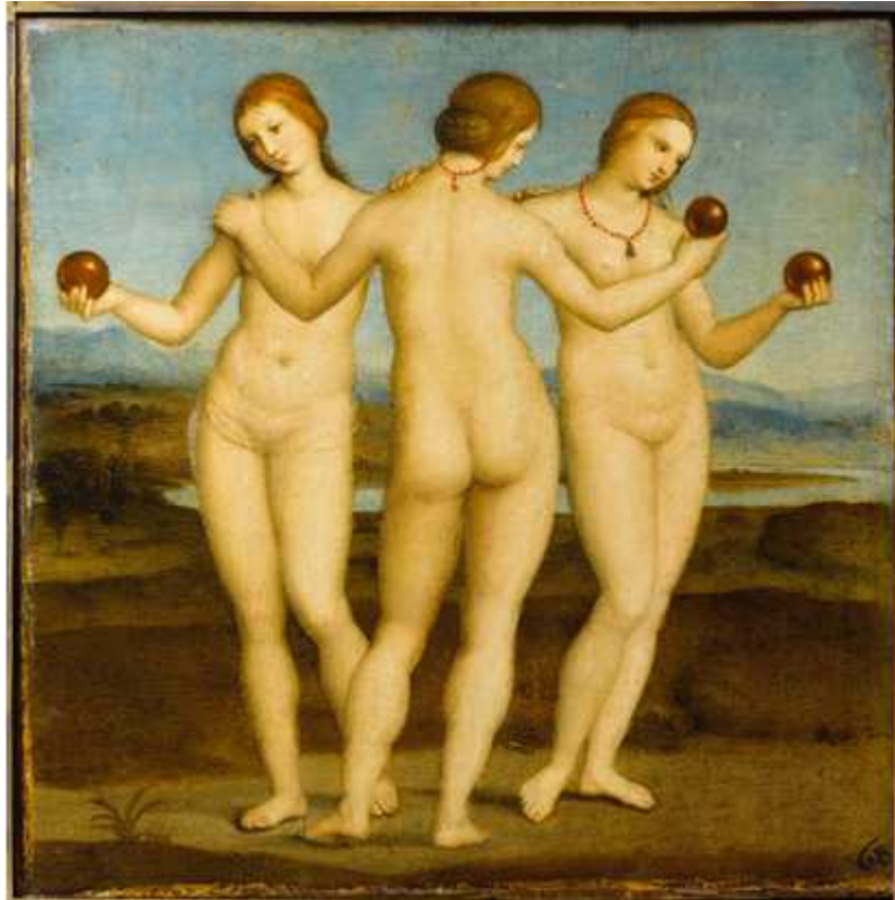
Les Trois Grâces , Raffaello Santi ou Sanzio dit Raphaël – 1503/1508 ?