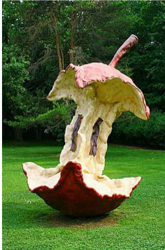
Trognon de pomme, Claes Oldenburg , Californie