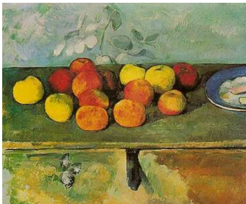
Paul Cézanne, Pommes et biscuits , 46 x 55 cm, 1879-1882. Musée de l'Orangerie