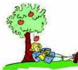
Isaac newton (1643-1727), physicien anglais http://fr.wikipedia.org/wiki/Isaac_Newton