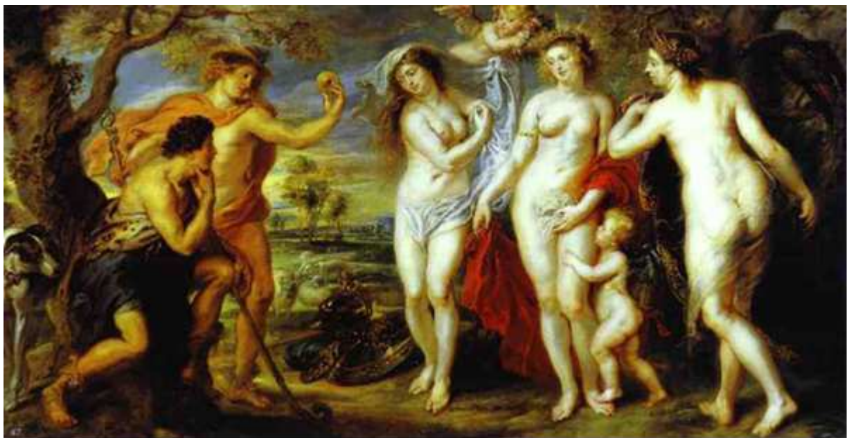
(Rubens , le jugement de Pâris) La pomme de la discorde