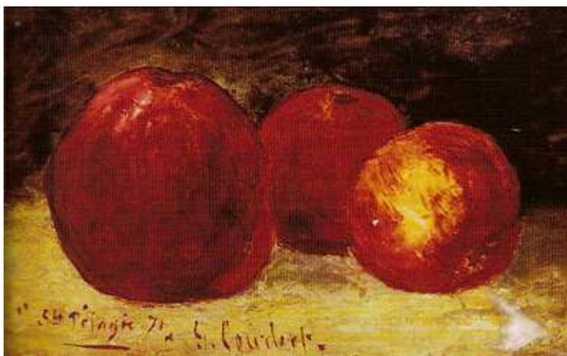
Gustave Courbet, Trois pommes rouges, 1871, Musée d'Orsay, Paris.