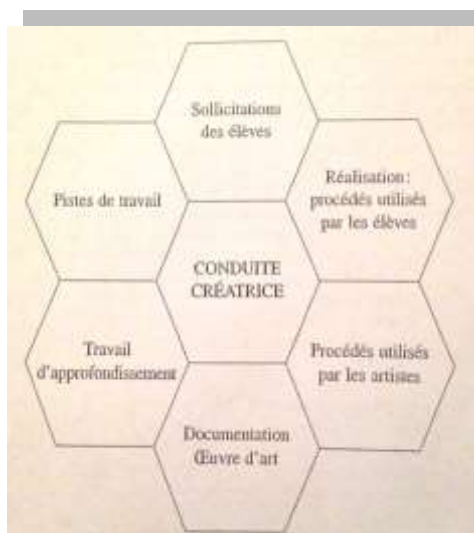
Schéma de la conduite créatrice selon Daniel Lagoutte*

NB : L'ordre des phases 2, 3, 4, 5 peut varier d'un projet à l'autre.