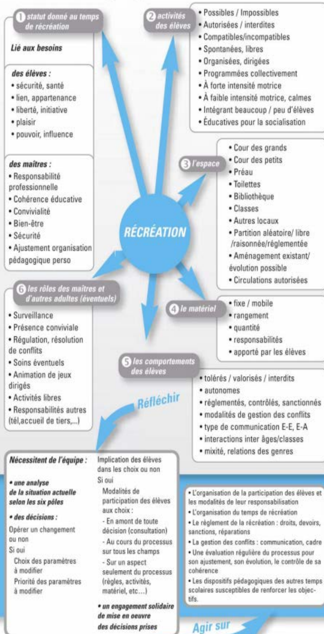
Schéma paru dans la revue Animation & Education - juillet-Octobre 2013 - n°235-236 Retrouvez l'intégralité de la démarche dans l'article en libre accès sur http://animeduc.occe.coop