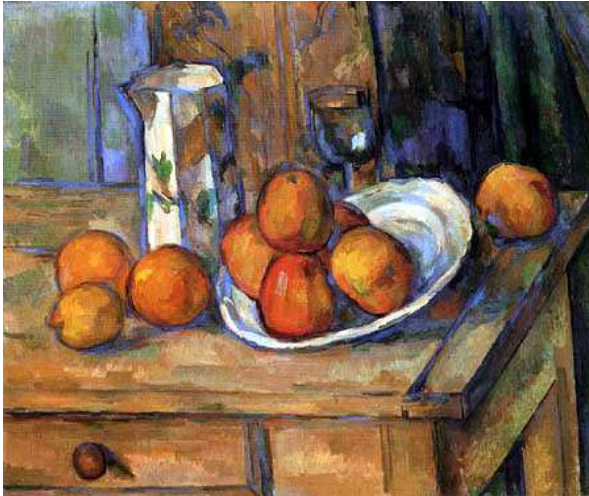
Paul CEZANNE Pommes sur une table 1900