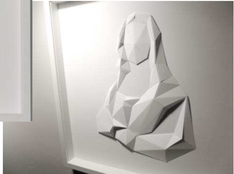
Arnaud MARULLAZ Pliage