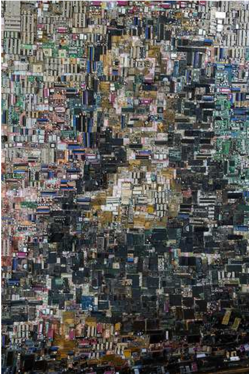
Cartes mères d'ordinateur