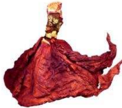
"Diva en vertugadin de chou carminé"