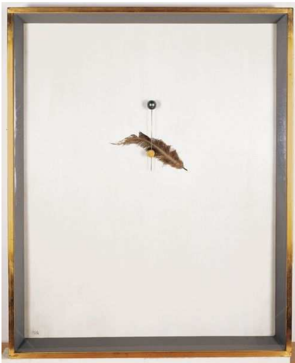
Joan MIRO Portrait d'une danseuse 1928