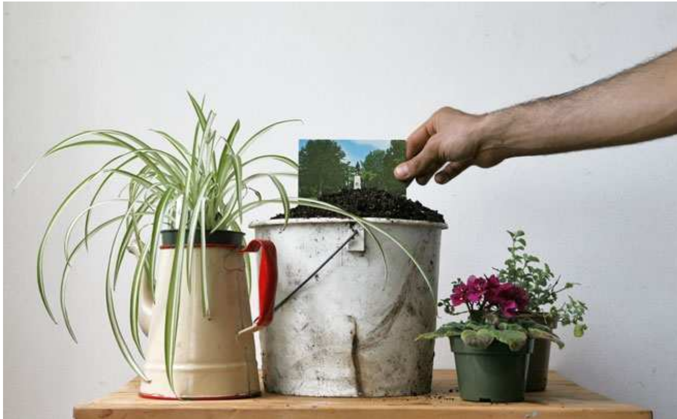
Basil ALZERI Redonnez vie aux cartes postales