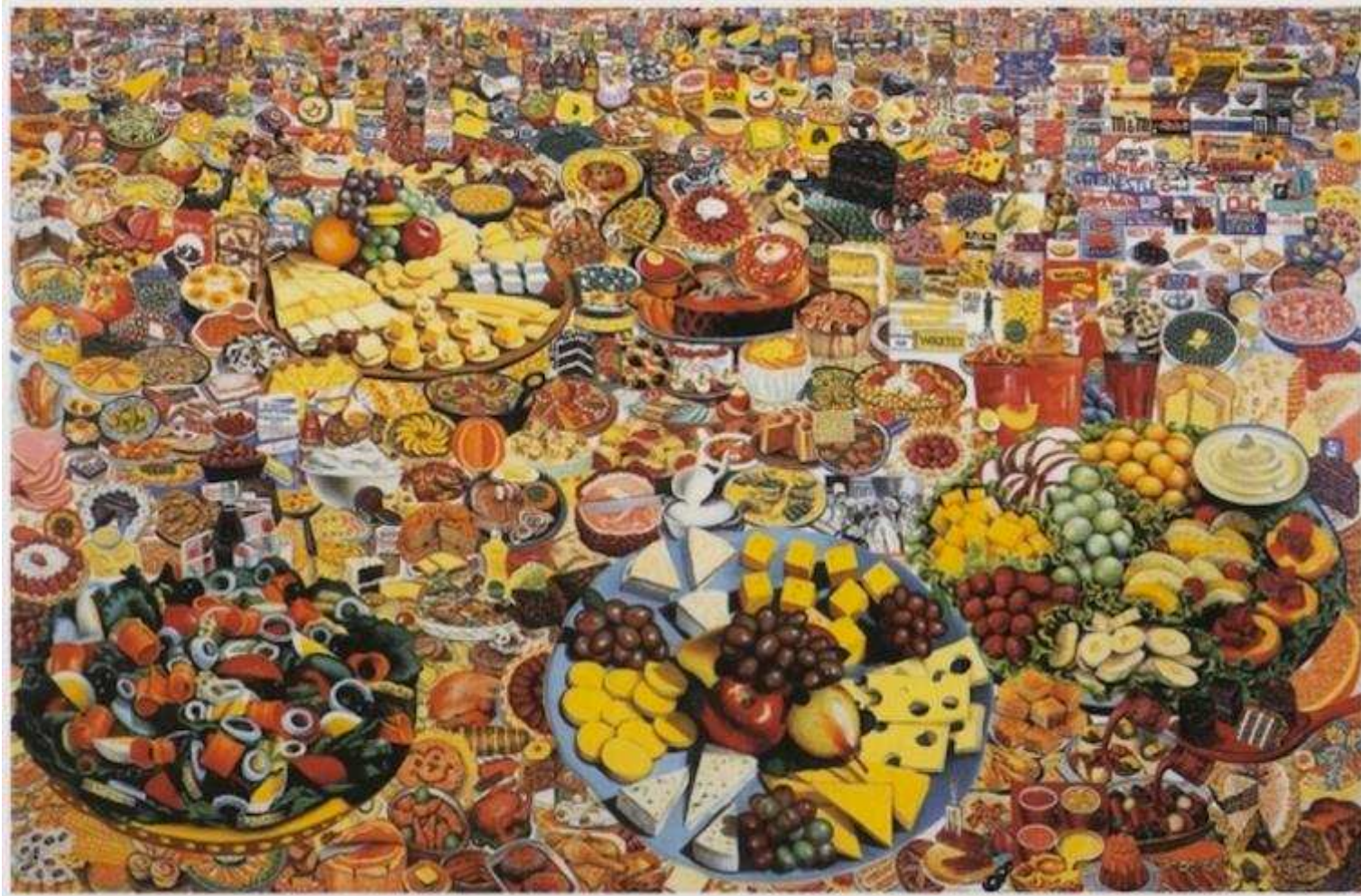
ERRO Foodscape 1964