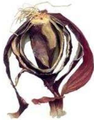
"Epouvantail d'oignon rouge façon Vitalis"