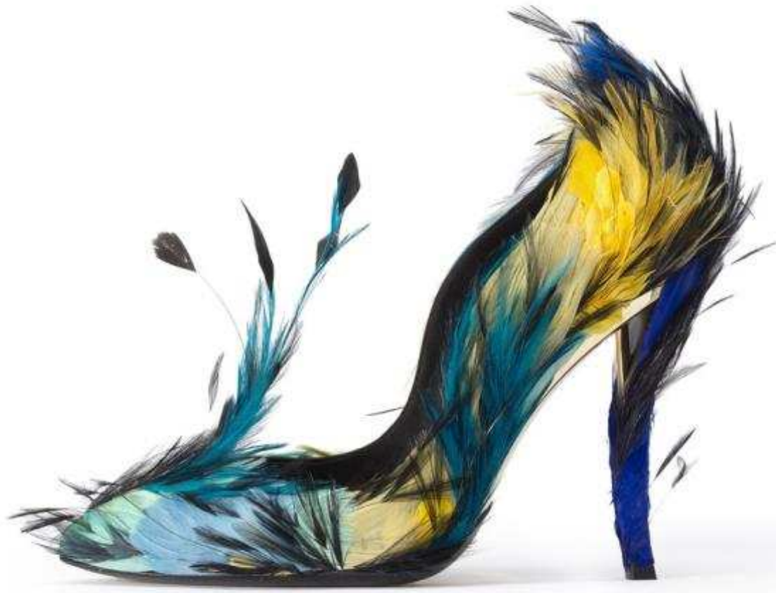
Roger VIVIER Blue angel 2012