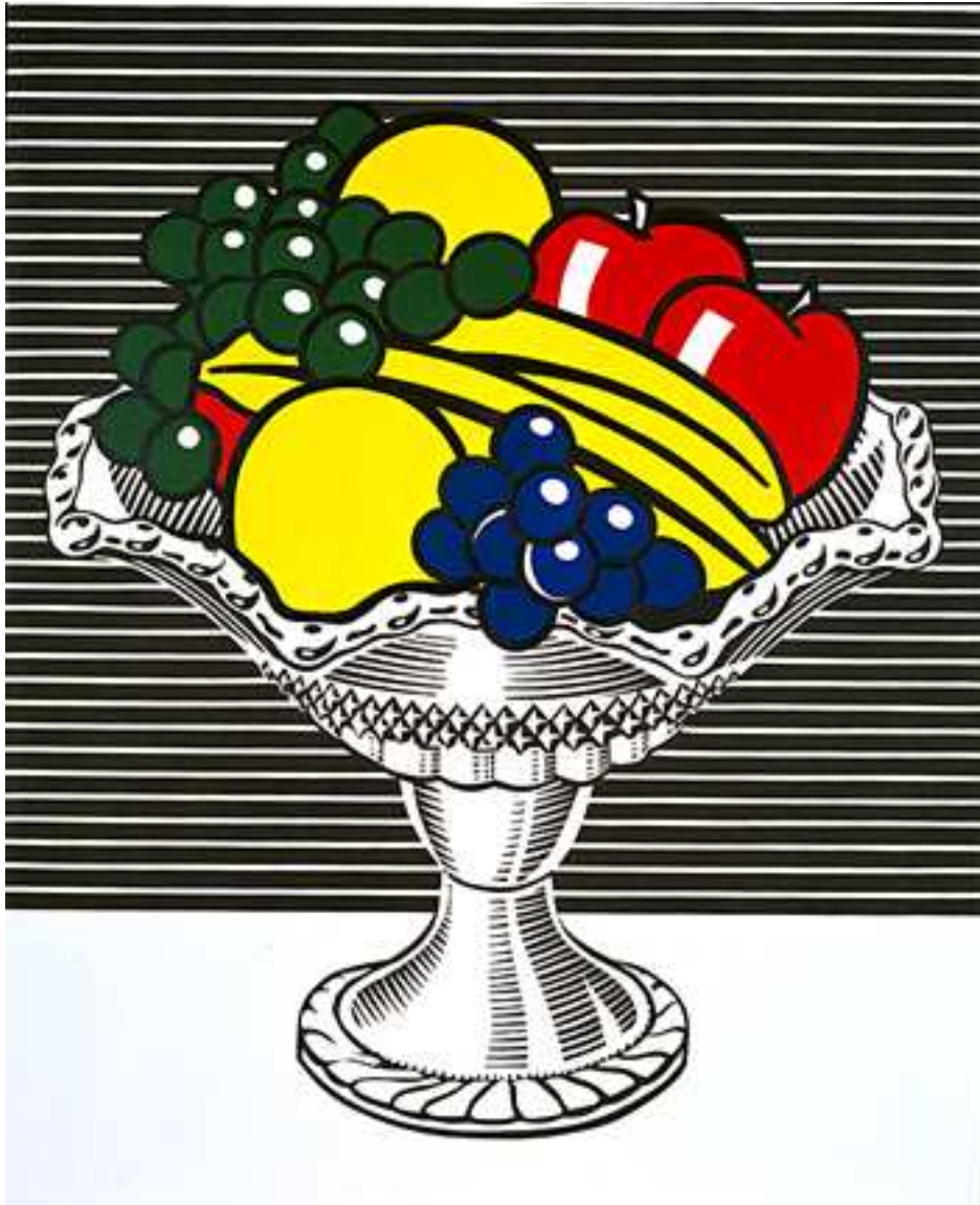
Roy LICHTENSTEIN Still life with crystal bowl 1973