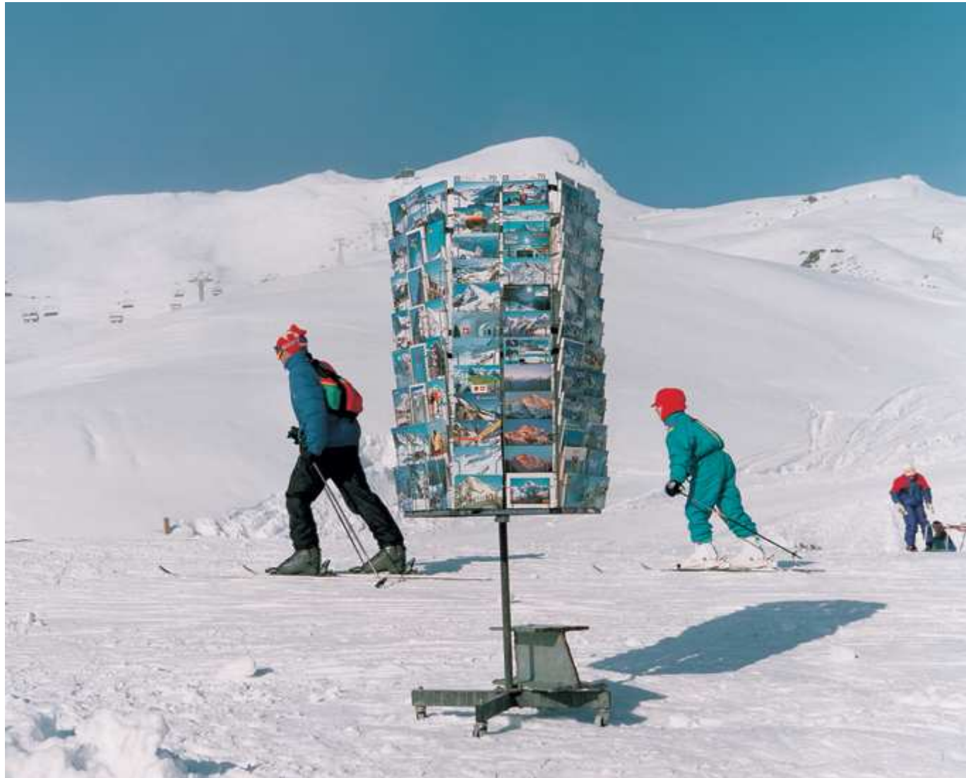
Martin PARR Kleine Scheidegg, Switzerland from the series Small World (1987-1994)