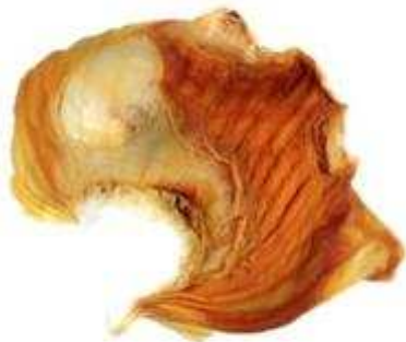
"Lamproie en peau d'oignon colérique"