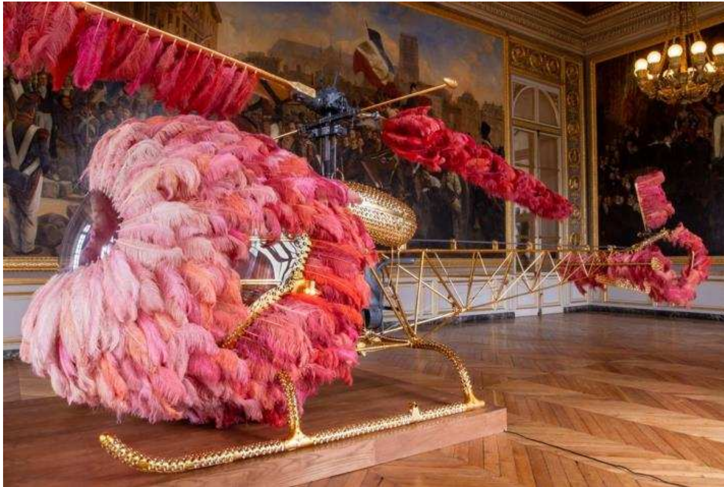
Joana VASCONCELOS Lilicoptère 2012