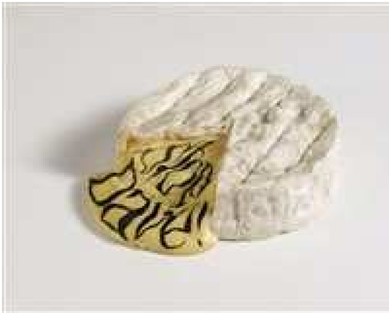
Gilles BARBIER Stop Dave