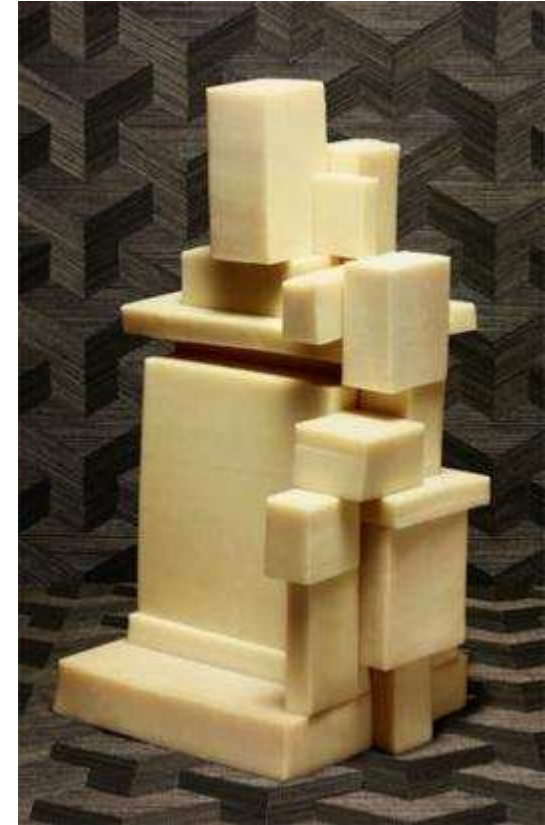
ICH & KAR Totems de fromages Milk Factory 2011