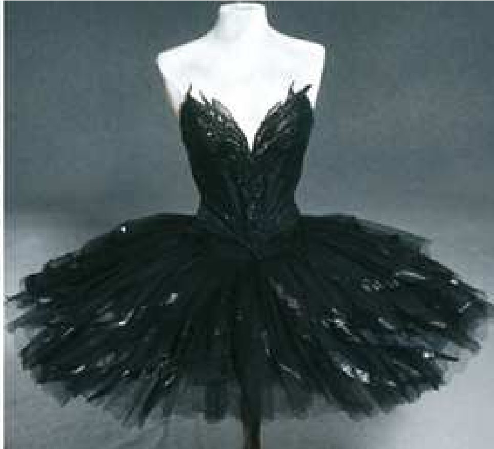
A gauche : Robe en laine métal lavée et plumes d'autruche bleu marine, chaussures en veau souple noir – Alber Elbaz pour Lanvin, Collection Automne Hiver 2010, A droite : Tutu « anglais » en tulle noire et plumes rehaussé de peinture dorée, costume pour le rôle du cygne noir dans Le Lac des Cygnes, Opéra National de Paris Bastille – Tomio Mohri, 1992