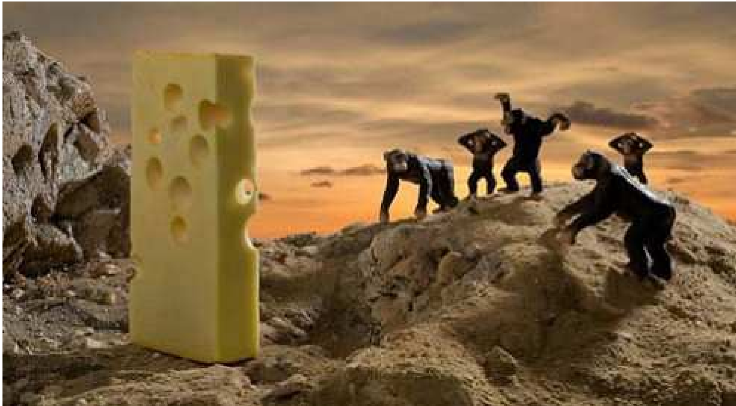
Gilles Barbier La Méga maquette (la chambre des fromages), 2006 technique mixte environ 50 x 70 x 60 cm