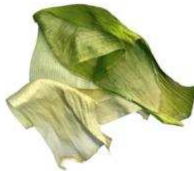
"Hidjab de rainette en nage de poireaux"