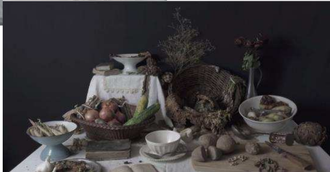
Stéphane SOULIE Nature morte vivante avec chrysalide Vidéo 2011