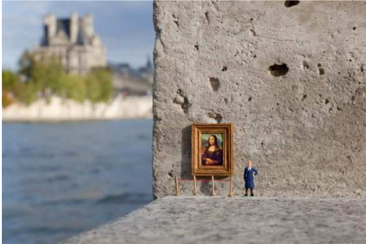
Slinkachu, Le Louvre