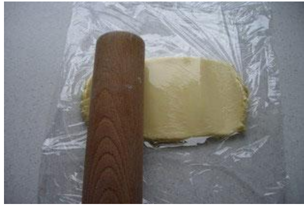
TAPER LA PÂTE