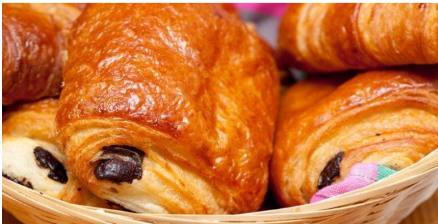
PAIN AU CHOCOLAT