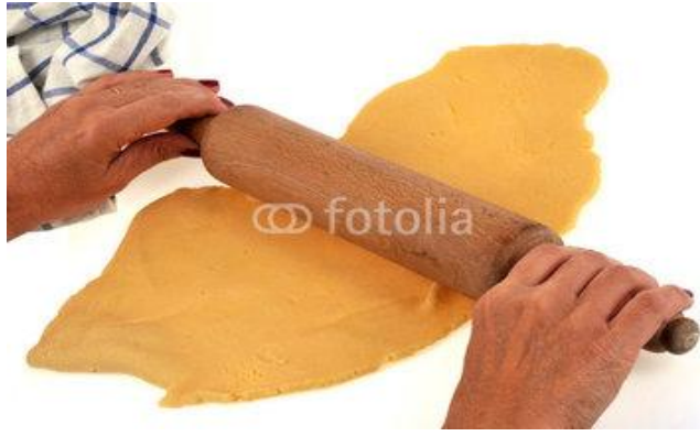
ROULER LA PÂTE