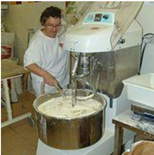
MELANGER LA PÂTE