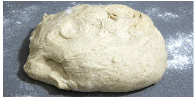
PÂTE A PAIN