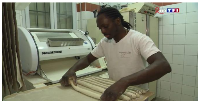
FABRIQUER LE PAIN