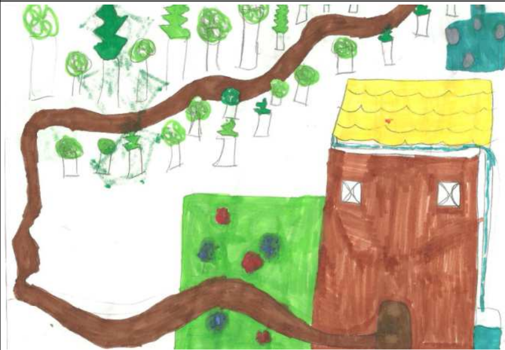
Le chemin du bois jusqu'à la maison des sept nains.