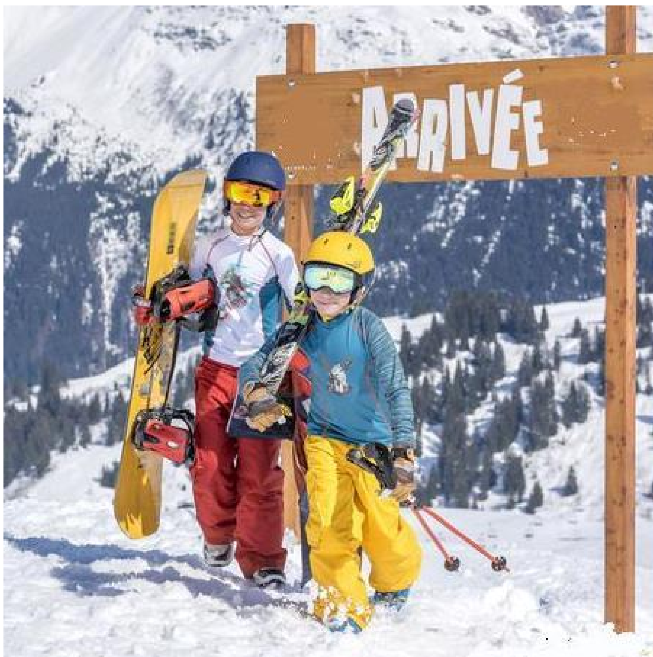
ILLUSTRATION DE L'ÉPREUVE :