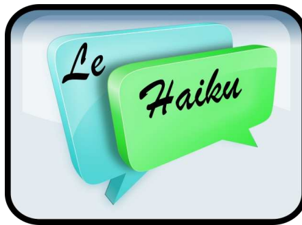
Phase 2: le Haïku

du 09/11/2017 au 17/11/2017 Rencontre synchrone le vendredi 17/11/2017.