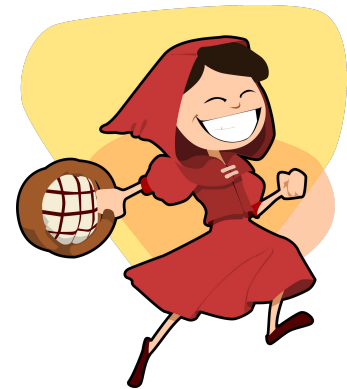
Phase 3: le conte traditionnel (ou presque)

du 11/01/2018 au 19/01/2018. Rencontre synchrone le 19/01/2018.