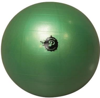
Ballon de Poulball