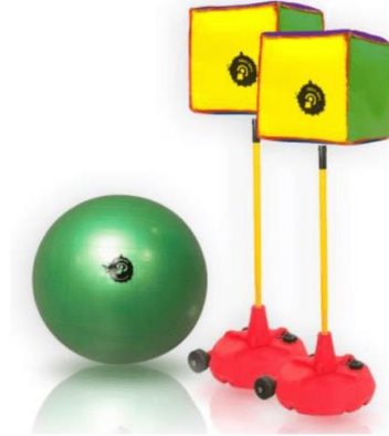
F Matériel de Poulball