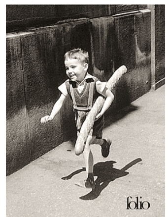
Willy Ronis Ce jour-là

« J'ai la mémoire de toutes mes photos, elles forment le tissu de ma vie et parfois, bien sûr, elles se font des signes par-delà les années. Elles se répondent, elles conversent, elles tissent des secrets. » (p.149)