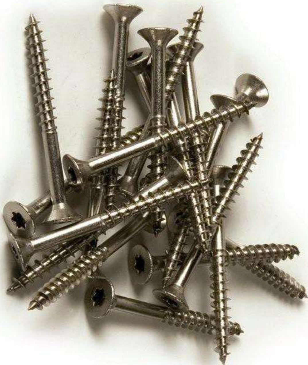
ILLUSTRATION DE L'ÉPREUVE :