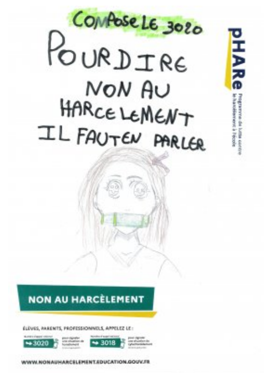
Affiches de l'école élémentaire de Doudeville